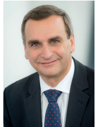
Oberkirchenrat Michael Martin

Der bayerische Regionalteil dieser Orientierungshilfe, der ständig erweitert werden soll, nimmt unterschiedlichste weltanschaulich-religiöse Strömungen und Gruppen in den Blick, wie sie insbesondere im Bereich der ELKB anzutreffen sind. Er möchte einen schnellen Überblick über einzelne religiöse Gemeinschaften und Bewegungen geben und zugleich auch eine Einschätzung aus christ-